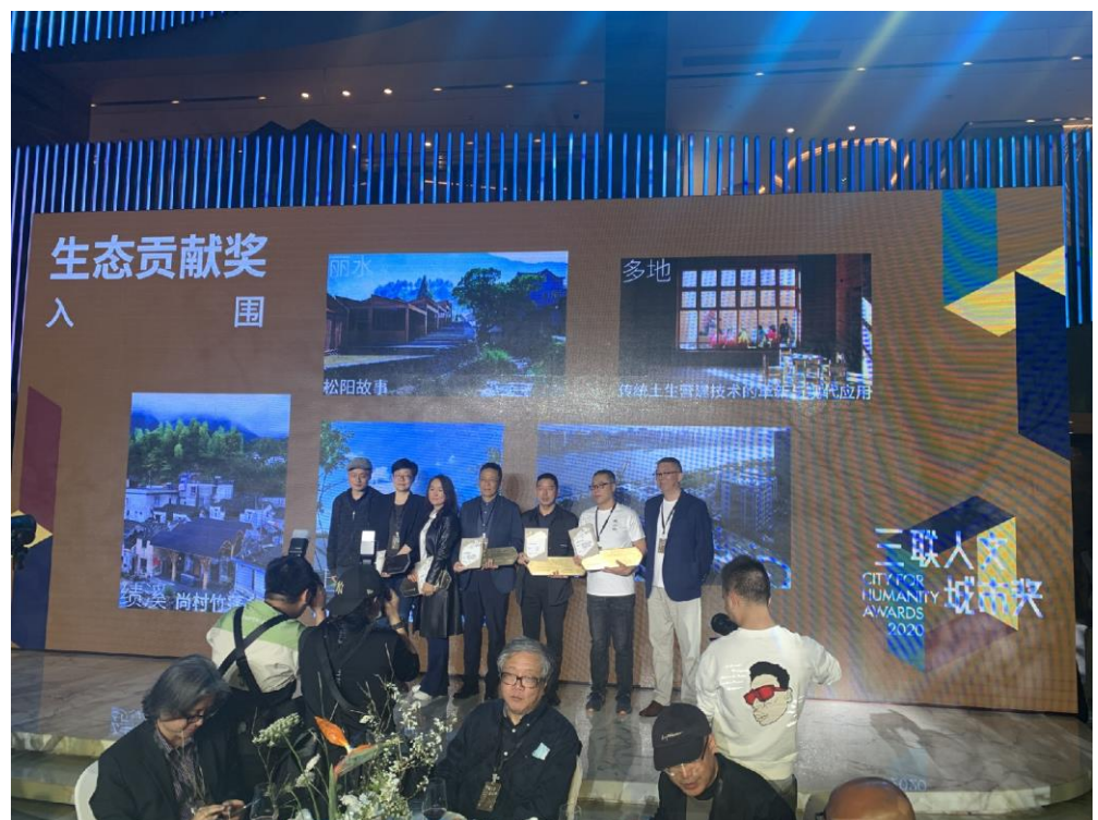
基金代表上台領取生態貢獻獎入圍獎