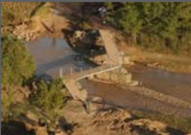
位於甘肅柳灘村的香港維多利亞學校無止橋於十月六日竣工。