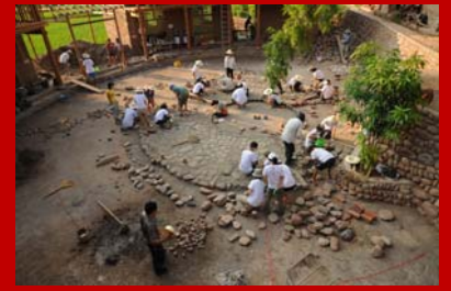
馬鞍橋村村民公共活動中心廣場的地面鋪砌與粉飾工程