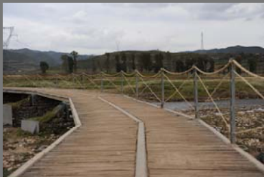
卡地亞無止橋狀況大致良好