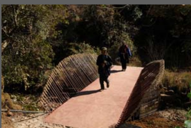
拉巴支村的橋樑以貨櫃的廢鐵製成，非常環保。