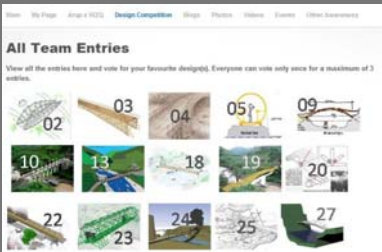
奧雅納舉辦的無止橋橋樑設計的網上投票活動