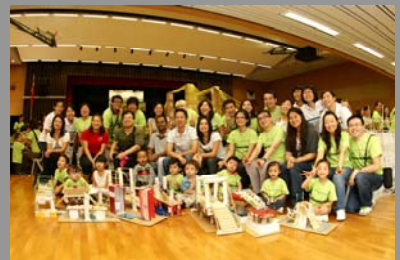
「香港維多利亞學校無止橋」親子橋樑模型活動

維多利亞教育機構、滬江維多利亞學校及其家教會早前舉行了「香港維多利亞學校無止橋」親子橋樑模型籌款活動。活動中，家長和小朋友一同利用循環再用物料，製作橋樑模型，並通過心意卡向內地村民送上關心和慰問。這活動不但增進親子關係，更讓參加者認識到內地偏遠農村的生活狀況。