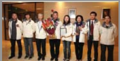
無止橋團隊代表出席中國建築傳媒獎頒獎典禮。

藉著過去三年多的農村建橋和災後重建項目，無止橋團隊獲得了建築同業的關注，在中國建築傳媒獎頒獎典禮上獲頒組委會特別獎。該獎項旨在表彰兩岸三地深具人文關懷、其發起或主導的建築活動在社會上產生積極影響的個人或團隊。獲得是項殊榮，實在是無止橋及各位志願者共同努力的成果。歡迎 按此 瀏覽有關新聞報道。