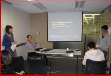
奧雅納工程顧問公司為兩校團隊進行現場監督工程簡介會。