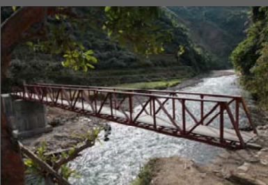
雲南西邁無止橋是志願者與當地村民合作的成果