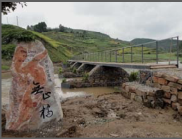
位於跑馬坪鄉的鄧思哲無止橋在八月二十一日竣工