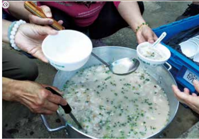
⑥荔枝窩村群英姐的茶粿檔供應雞粥及各式茶粿，黃錦星感謝村民辛勤付出