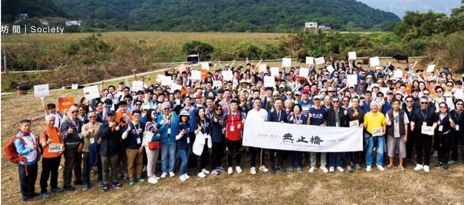
▲ 超過200名來自不同企業和機構的人員及當地村民、義工參與無止橋「村永續公益行」，感受古時村民足跡之餘，藉機加深對新界東北鄉郊復育