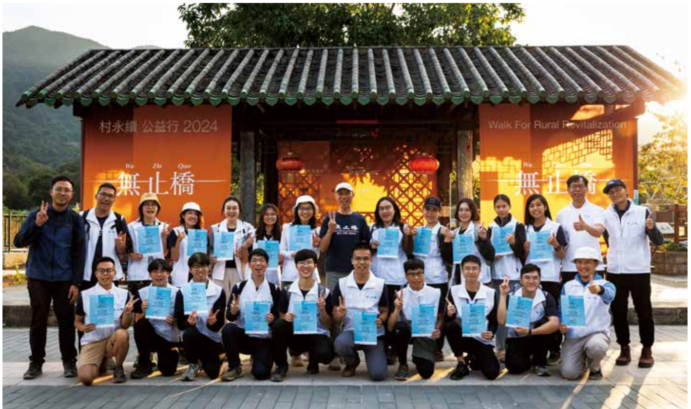
▲ 黃錦星向「無止橋村永續青年領袖」頒發基礎班結業證書，深造班將於4月開班，冀深度培育青年擔當推廣鄉郊可持續發展的橋樑角色

沙頭角谷埔村田心李宅舉行。主禮嘉賓、鄉郊保育辦公室總監鄧文彬致辭時表示：「期望通過現行和未來的各項措施，保護香港珍貴的生態、文化和建築環境，除了為偏遠鄉郊帶來新的生機，還可以促進生態旅遊和文化活動等可持續經濟活動，從而連結城鄉，實現城鄉共生的理念」。