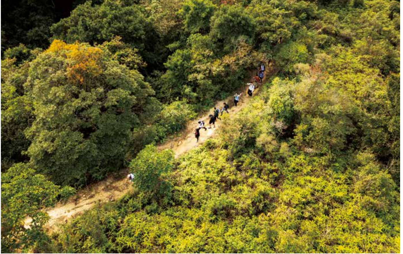
▲ 天公造美，首次「村永續公益行」慈善活動的參與者於冬日暖陽下穿行於「荔-梅-谷」古道