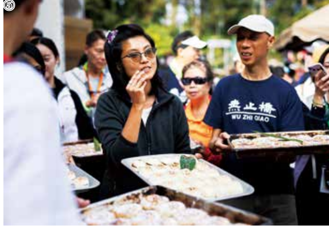
⑧香港中文大學建築學院的遊谷探埔計劃開創大學與村落合作的行動式鄉郊保育夥伴模式