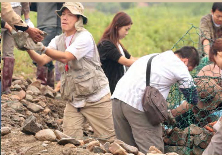
2005 年暑期義工齊集毛寺村以環保手作方法建橋