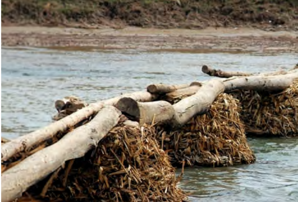
那些年毛寺村村民只靠簡陋獨木橋渡河

廿多年前，中國內地貧鄉不少，黃土高原上甘肅毛寺村是例子之一。蒲河分隔村莊，那些年村民只靠簡陋的獨木長橋渡河。2003-2004 年間，我倆和一些志願伙伴有緣遠赴毛寺村考察，見村童過河上學，時刻面對遇溺之險，大家都心生各盡綿力的希望，支持「良橋助學夢成真」義務計劃。