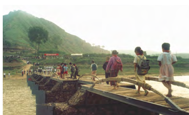
2005 年良橋助學夢成真

小橋泛起了香港社會人士的大愛，倡議正式成立公益團體，凝聚共同理念者同行善舉。2007 年，無止橋慈善基金（英文簡稱 WZQ）在港註冊，至今年 18 歲了！十餘年來，感謝逾五千位學生及青年義工的參與，在內地鄉間共建了 6 個村民中心和 55 條人行便橋，受益村落約 60 條，受惠村民數以萬計。近幾年，內地隨著農村脫貧的歷史階段，緊接是名為鄉村振興的重要政策出台。2017 年，香港政府亦推出新政策以復育本地偏遠鄉郊，當中希望各界參與其中，支持鄉郊可持續發展。鑒於上述兩地類近新政同時面世，WZQ 與時俱進，當前方向可概括為「兩地鄉建，深耕永續，多元參與，廣搭心橋」，旨於為連繫香港和內地鄉村振興作出示範，當中會加強結合永續理念和青年多元參與，令機構化身支持深耕兩地鄉郊永續的良伴及良橋。